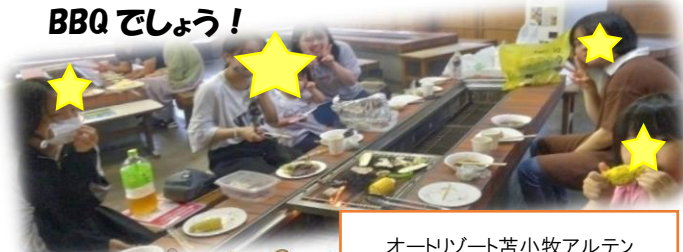
オートリゾート苫小牧アルテン